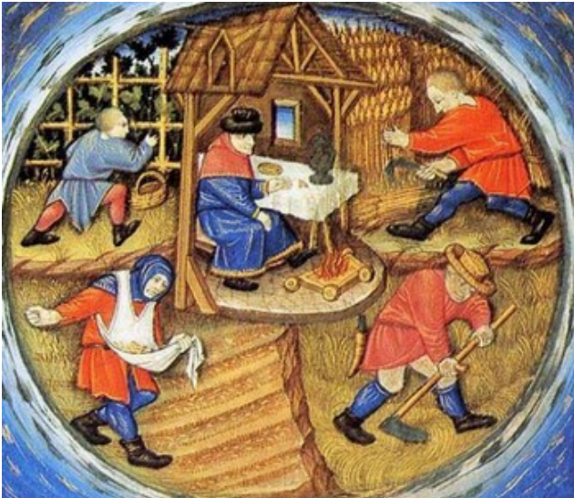
Imagem 5. Trabalho na Europa Medieval

http://ofrioquevemdosol.blogspot.com.br/2010/03/o-que-de-fato-move-o-pendulo-climatico.html