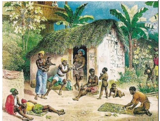
Imagem 8. Trabalho escravo na América portuguesa

http://mestresdahistoria.blogspot.com.br/2011/03/mon-tagem-da-area-de-producao-acucareira.html