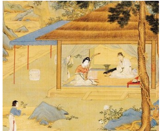
Imagem 6. Trabalho na Ásia Oriental Medieval

http://oridesmjr.blogspot.com.br/2013/05/os-grandes-imperios-medievais-da-asia.html