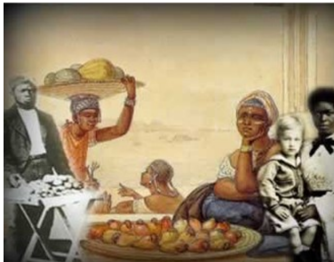
Imagem 3. Mulher e trabalho no século XIX: a vida dentro de casa

http://www.brasilecola.com/historiab/formas-trabalho-escravo-no-brasil.htm