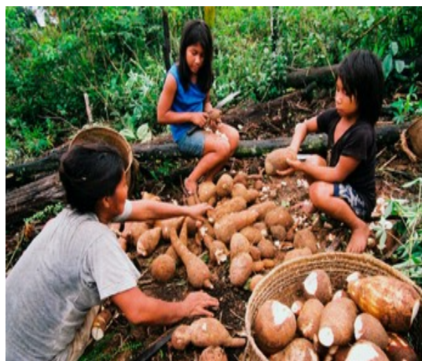
Imagem 4. Trabalho indígena

http://pibmirim.socioambiental.org/como-vivem/alimentacao