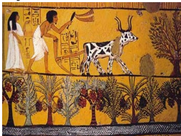
Imagem 1. Trabalho no Egito Antigo

http://teiadofatos.blogspot.com.br/2012/02/egito-antigo-dadiva-do-nilo.html