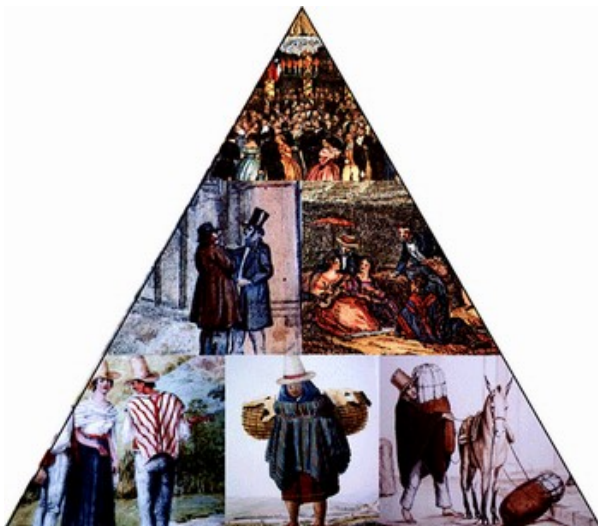
Imagem 7. Trabalho na América espanhola

http://portfoliovirtuaisalesiano.blogspot.com.br/2012/09/2008-revisao-para-prova.html